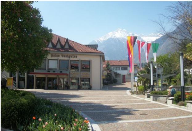
Casa Talguter dove avverrà l'incontro con tutti i Gruppi.

Punto d'uscita e incontro con gli accompagnatori senior