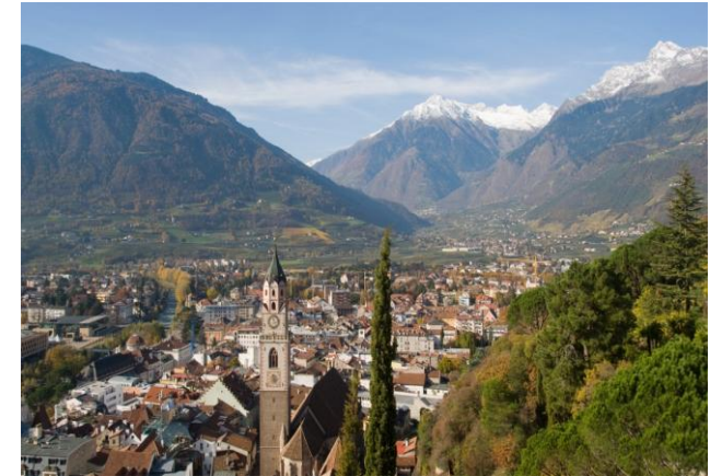
Vista sulla città di Merano