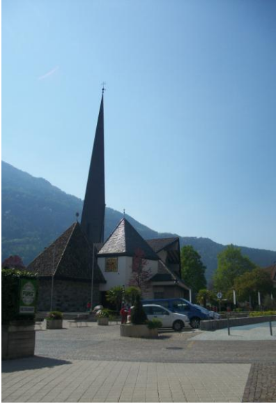
Chiesa di Lagundo, punto di ritrovo per la S. Messa.