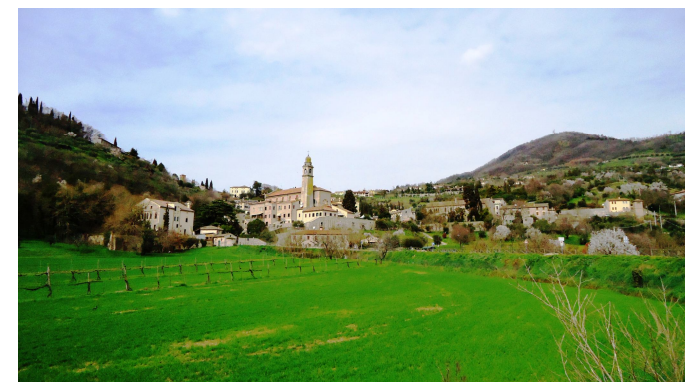
Vista Arquà Petrarca